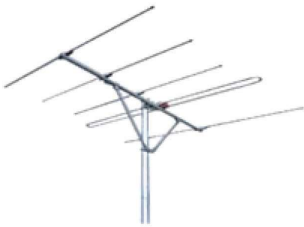
VHF LOW ANTENNA(LVH-0206) VHF FM ANTENNA(LFM-108-05H)