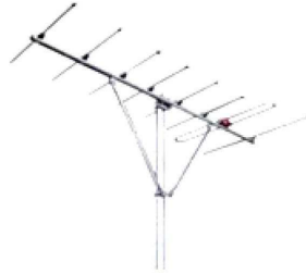
VHF HIGH ANTENNA(HVH-0713)